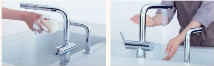
タッチレス水ほうき水栓LF(センサースイッチ)