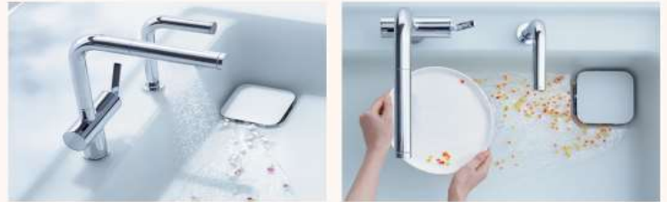
スクエアすべり台シンク(クリスタル)