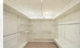
▲パイプやハンギングバー、棚の位置を細かく打ち合わせしたファミリークローゼット

会社概要 会社名: 光テック 代表者: 弘内喜代志 本社所在地: 高知県高知市 設立年: 1964年 社員数: 12名 事業内容: 住宅リフォーム・リノベーション、新築住宅工事など 会社売上高: 1億6000万円