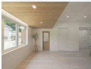
▲LDKの増築部分は天井が低いので板張りにしてあえて変化を付けた。南面から大きく採光をとっている