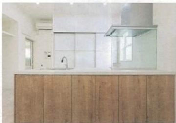
▲ダイニング側にカウンター下収納があるLIXILのアイランドキッチン。背面の3連収納はTOTO製と、用途に合わせて違うメーカー商品を採用