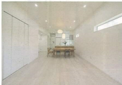
▲白い床・壁・天井に木目が映えるLDK