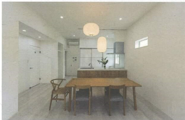
▲ダイニングテーブルの上に2つのシンボルライトが下がる

真っ白い空間に木目調のアイランドキッチンの収納やダイニングテーブルがアクセントとなっている。ダイニングテーブルの上には、リンクテーブルのシンボルライト2つが下がり、まさに食を通じて家族が集まる「ヒュッゲ」居心地のいい家が完成した。