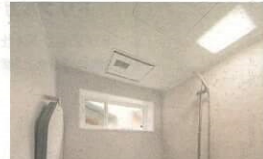
▲姉妹の部屋から次男の階段横スペースを見る